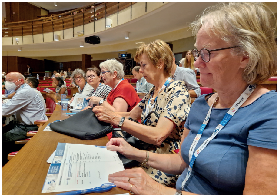
Tijdens het congres